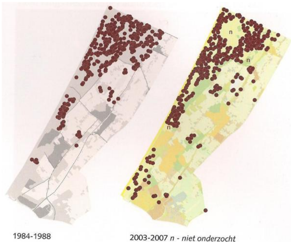
Geregistreerde territoria van nachtegalen in de Duin- en Bollenstreek gedurende de perioden 1984-1988 en 2003-2007. (Bron: Tussen tulpen en de zee, p. 291.)

gevarieerder geworden. Door afplaggen zijn onbegroeide stukken ontstaan waardoor weer natuurlijke zandverstuiving plaatsvindt en anderzijds heeft de in mijn jeugd schaars aanwezige struweelbegroeiing zich inmiddels aanzienlijk uitgebreid tot in de richting van de zeereep. Bij een volgend inventarisatieproject gedurende de jaren 2003-2007 werden in dit duingebied 10 territoria van nachtegalen gesignaleerd. Tijdens een fietstocht door de duinen van Noordwijk naar Katwijk heb ik afgelopen voorjaar, op hemelsbreed nog geen 300 meter van het strand, een nachtegaal horen zingen.